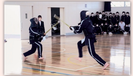
いつもは優しい川和男子もこの日は逞しい「剣士」に変身