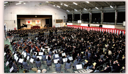
オーケストラの演奏で厳かに式が進みます