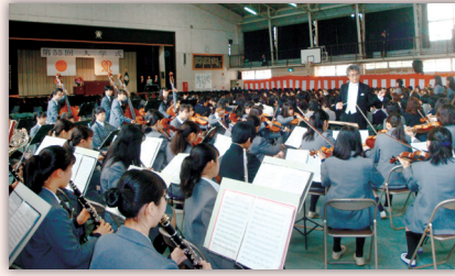
オーケストラの演奏に合わせて新入生入退場