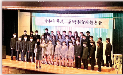
美術・書道は作品展、音楽は合唱コンクール