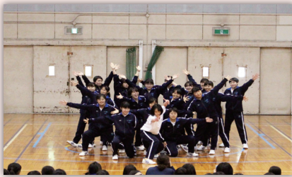
クラスが一致団結