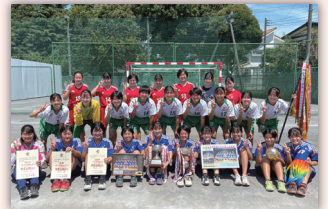
女子ハンドボール部