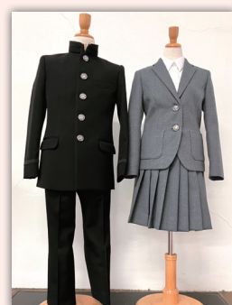
制服(※女子スラックスもあり)