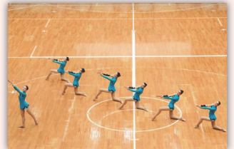
バントフリング部