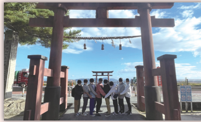
琵琶湖にて(学年によって行き先は様々です)