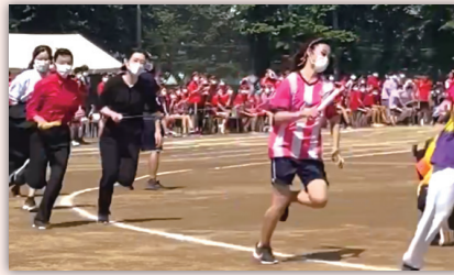
部活動対抗リレー