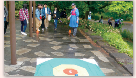
1年生にとっては親睦を深めるいい機会になります