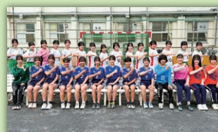
女子ハンドボール部