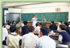
理科(物理)授業風景