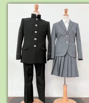
制服(※女子スラックスもあり)