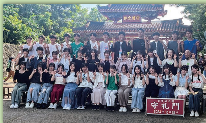
修学旅行(2024年沖縄方面)