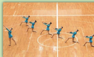
バトントワリング部