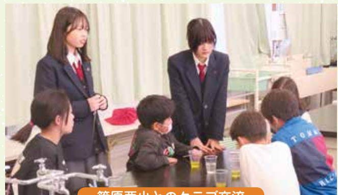
篠原西小とのクラブ交流