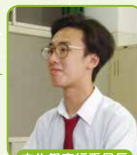
文化祭実行委員長

岸根高校最大の行事の1つである岸高祭です。昨年度より外での出店が再開したことによってより一層活気があふれるものとなりました。生徒たちによるバラエティに富んだ企画が見所です。