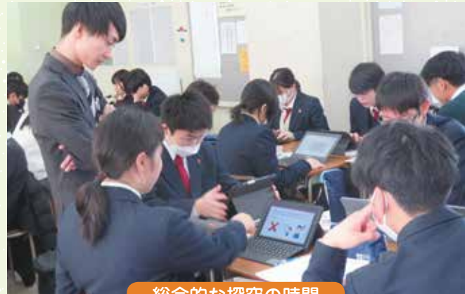
総合的な探究の時間