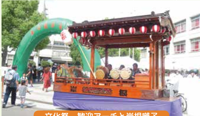
文化祭 歓迎アーチと岸根囃子