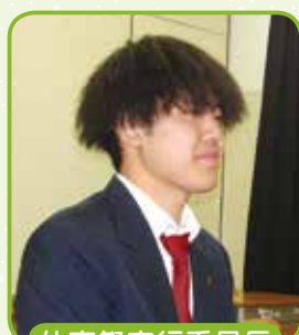
体育祭実行委員長

体育祭です！特に応援団のパフォーマンスが一番の魅力です。各色学年関係なく、力を合わせて最高のパフォーマンスを当日に披露してくれます。学年種目ではクラスで一致団結して頑張ります。