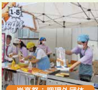
岸高祭：調理外団体