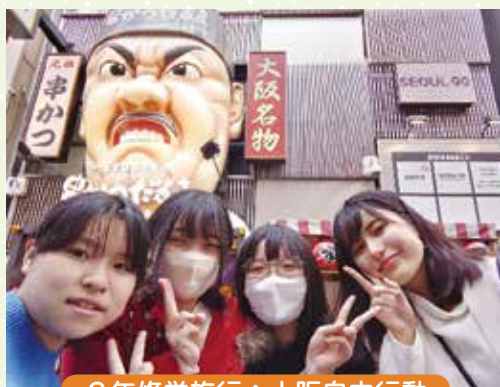
2年修学旅行：大阪自由行動