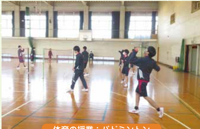
体育の授業：バドミントン