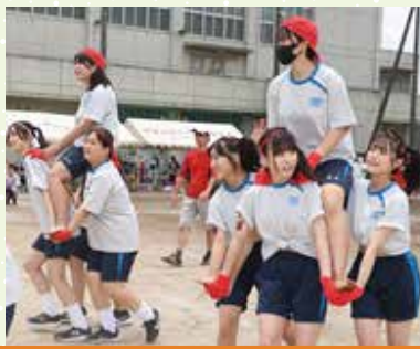
コロナ前にあった騎馬戦が復活！