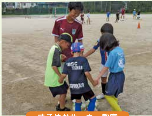
すこやかサッカー教室