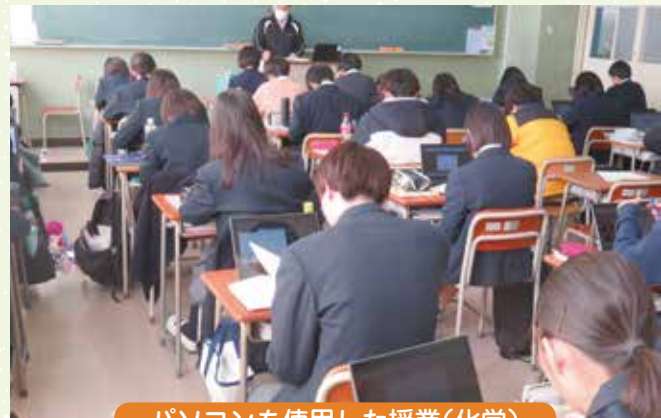
パソコンを使用した授業(化学)