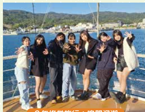
2年修学旅行：鳴門渦潮