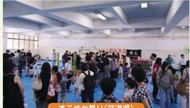
すこやか祭り(武道場)