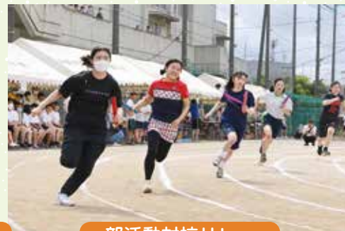
部活動対抗リレー