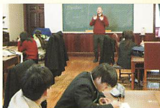
イングリッシュキャンプ