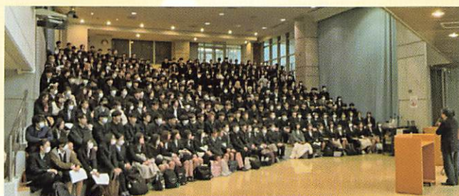
横浜国立大学体験授業

本校同窓会の全面的なバックアップのもと、1・2年生対象の卒業生によるキャリアガイダンスを毎年開催しています。各方面で活躍している幅広い年代の本校の卒業生から、自己の進路選択の体験談や職業観などの貴重な話を聞くことができます。