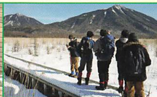
ワンダーフォーゲル部