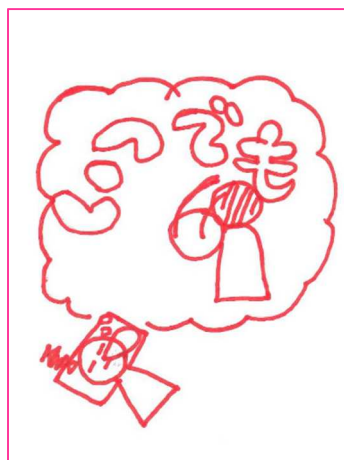
いつでもあいさつ。