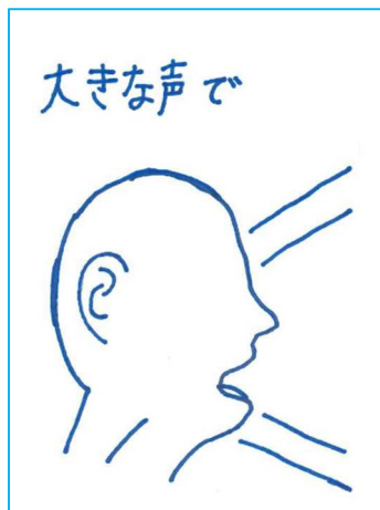
大きな声であいさつ。