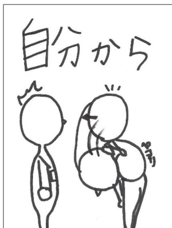
自分からあいさつ。

9月12日（月曜日）から10月5日（水曜日）の間、分教室では「あいさつ運動」に取り組みました。下校前に各学年から代表が出て、積極的にあいさつをしました。