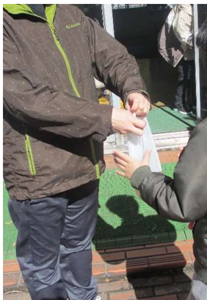
買った飲み物は、袋に入れて教室まで持ち帰りました。