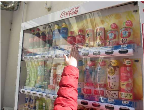
がんばって手を伸ばして、ボタンを押しています。