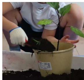
プランターにミニトマトと なすを植えました。