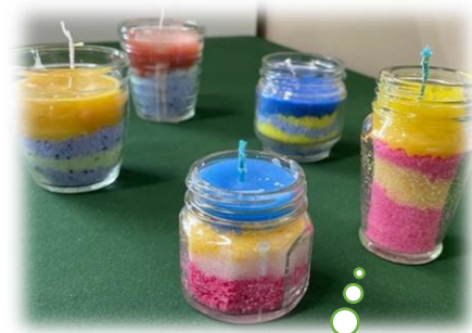
「校長室の作品展示」 高A ソルトキャンドル

これまでと同じ方法での教育活動は難しいこともありますが、新しい生活様式をとりいれ、できないからとあきらめるのではなく「どうすればできるか」という視点を大切に