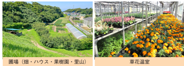
圃場（畑・ハウス・果樹園・里山）