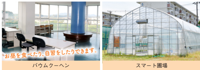
お昼を食べたり、自習をしたりできます。 バウムクーヘン