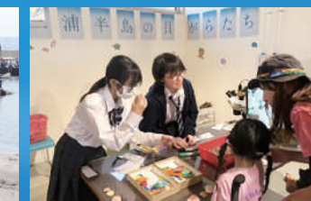
三浦半島の貝殻たち