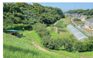
園場 (畑・ハウス・果樹園・里山)