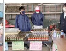
⑥収穫祭 (和田キャンパス)