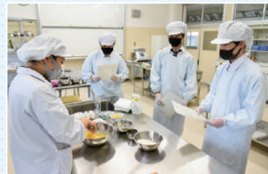
実習等で食品について学びます