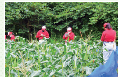
栽培を基礎から学びます