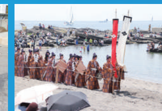
道寸祭 笠懸の諸役として参加