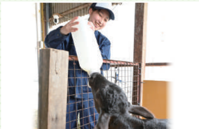
いのちを感じ、考えます