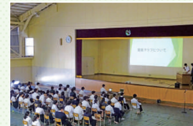
プレゼンテーションの機会も豊富