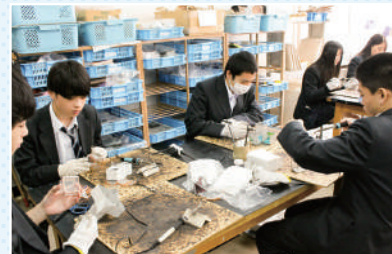
スタンドグラス制作