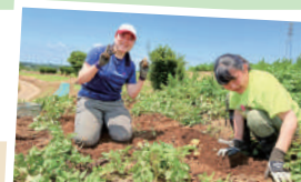
学校外で週1回、まる1日実習します