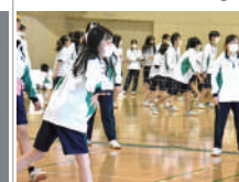
⑧スポーツフェスティバル