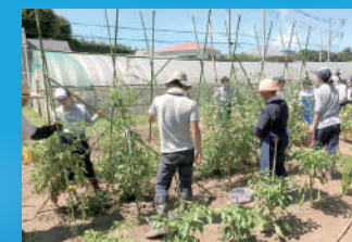
農業と環境 (増単) 地域の人と実習に臨む

三浦市唯一の県立高校として、地域との結びつきを大切にしています。三浦一族所縁の道寸祭りへの参加や、近隣の小学生を対象にした夏期講座の開講、地域の方に親しまれる農業科の直売など、生徒たちは地域と関わり、地域とともに成長していきます。