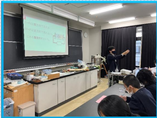
Odatech (SSHに関する特別な講座)