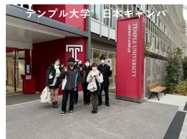
テンプル大学 日本キャンパス