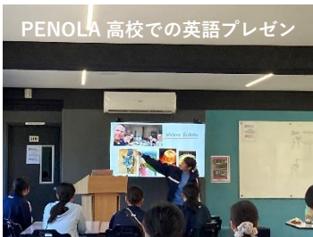
PENOLA 高校での英語プレゼン