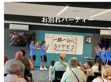
お別れパーティー