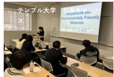
テンプル大学 日本キャンパス