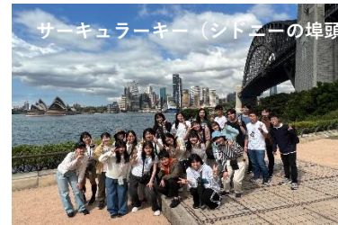
サーキュラーキー（シドニーの埠頭）