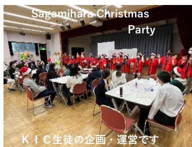
Sagamihara Christmas Party