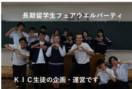
長期留学生フェアウエルパーティ