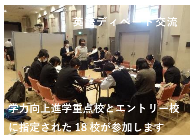
英語ディベート交流