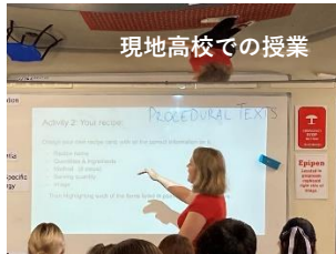
現地高校での授業