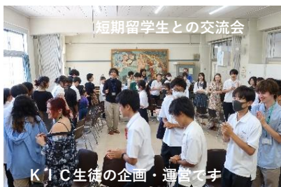
短期留学生との交流会