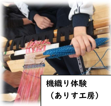
機織り体験 （ありす工房）

10月9日（水）・16日（水）本校体育館にて「ありす工房（生活介護事業所）」「ほっとさーくる（生活介護事業所）」「はーとらんど（生活介護事業所）」「レインツリー上溝・淵野辺（就労継続支援 B 型事業所）」の職員の方々を招き、実際の事業所で取り組んでいる作業を校内実習の学年グループ対象に1人2か所体験させていただきました。初めて取り組む作業ではありましたが、集中して取り組む姿や完成した際には「できました」と報告する姿、作品を褒められて嬉しそうな表情が見られました。実践的体験的な学習を通して働くことに対する意欲や関心を高め、将来の職業生活にかかわる作業体験の場をなりました。是非、進路面談等で様子を共有し、見学先の候補先や今後の進路選択のご参考にしていただければ幸いです。