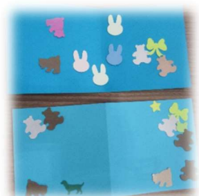
リース作り （はーとらんど）