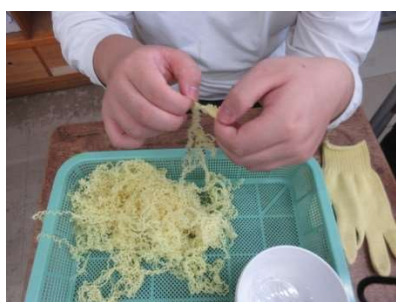
アラミド繊維の分別