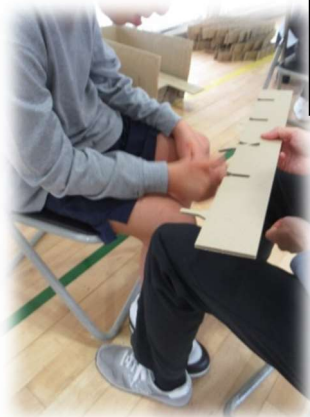
段ボール加工作業体験 （ほっとさーくる）