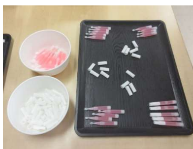
接着剤のキャップ・封入作業