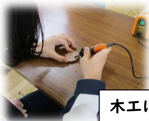
木工によるキーホルダー製作 （レインツリー上溝・淵野辺）