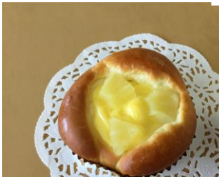
パインカスタード