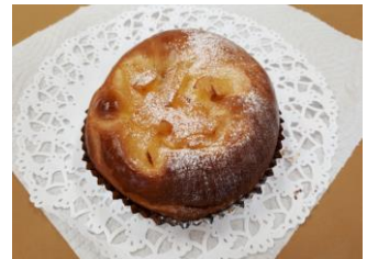
アップルシナモン