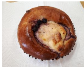
ブルーベリーチーズ