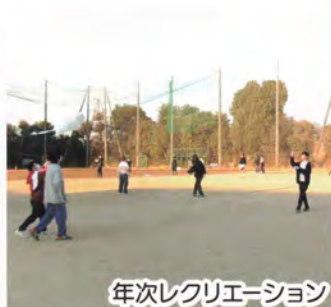
年次レクリエーション