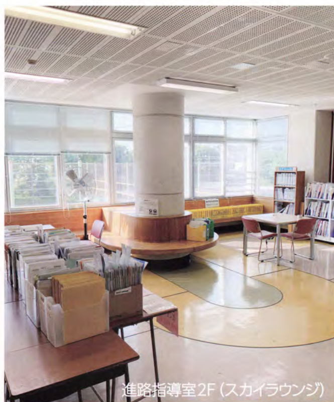
進路指導室2F（スカイラウンジ）