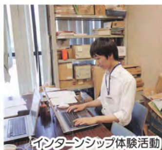
インターンシップ体験活動