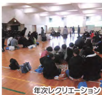
年次レクリエーション