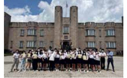
ブリティッシュヒルズ英語研修