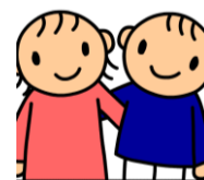
ドロップスより「友達」

本講演では、言葉だけに頼らないコミュニケーションの大切さを改めて確認し、子どもたちが「わかる」「できる」「伝えられる」視覚支援の活用方法について考えます。