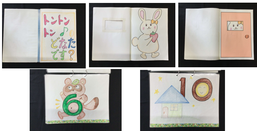
歌の絵カード 『すうじのうた』