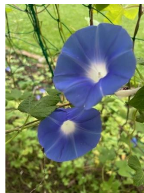
校長室前の朝顔 (2024/9/3 撮影)

保護者の皆様、地域の皆様におかれましては、引き続き本校の教育活動にご理解、ご協力をお願いいたします。