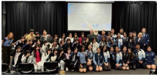
海外研修 オーストラリア訪問 Mabel Park State High Schoolにて