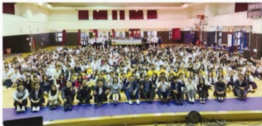
海外修学旅行 台湾訪問 台北市立松山高級工農職業学校にて