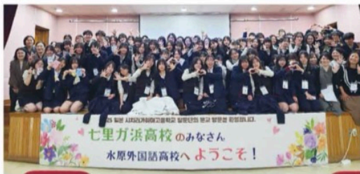
韓国 姉妹校交流 水原(スウォン)外国語高校にて