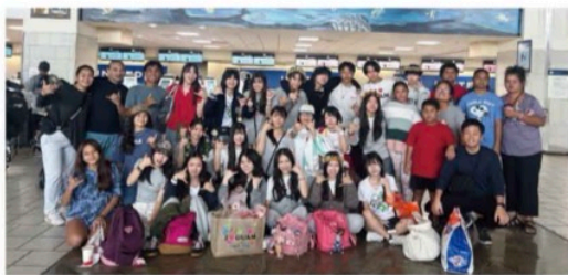
海外研修 グラム訪問 Saint Paul Christian Schoolにて