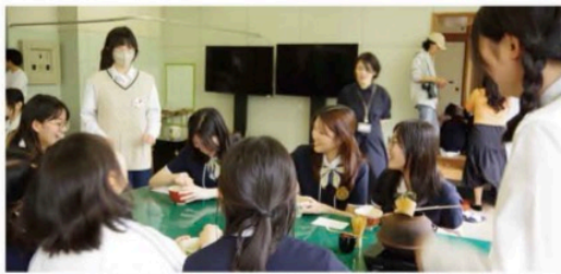
韓国 姉妹校交流 水原(スウォン)外国語高校来校 授業風景