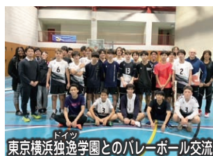
東京横浜独逸学園とのバレーボール交流