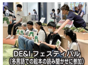
DE&I フェスティバル (多言語での絵本の読み聞かせに参加)