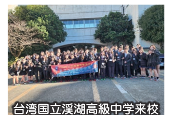
台湾国立溪湖高級中学来校