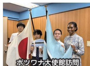
ボツワナ大使館訪問