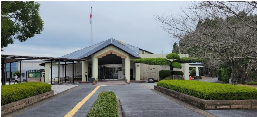
知覧特攻平和会館

我が胸の燃ゆる想いに比ぶれば煙は薄し桜島山 幕末の志士「平野國臣」が安政7年に詠んだ歌とされています。所説あるようですが、幕末福岡藩の志士「平野國臣」が島津藩主島津久光公に討幕を訴えたが、島津公には討幕の意思がなく、むなしく薩摩を去ったときに詠まれた歌だそうです。勇ましい歌に聞こえますが、実は失望して薩摩から福岡へ去った恨みの歌だったのでは？