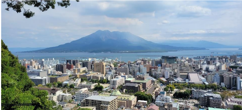
城山展望台から見た桜島山

校長コラムの更新が遅くなり、楽しみにしていた(?) 人には申し訳ありません。10月3日(火)、4日(水)に全国商業高等学校長会が鹿児島市で開催されましたので参加してきました。1年生は、来年9月の修学旅行で鹿児島に行きますね。空き時間を利用して下見を兼ねて鹿児島市内を散策してきました。私学校跡の石垣には西南戦争の銃弾痕が沢山残っていました。(写真を撮り忘れました)修学旅行で行った際にその目で見てみてください。さらに鹿児島中央駅からバスで1時間程乗車し知覧特攻平和会館にも足を延ばしてみました。