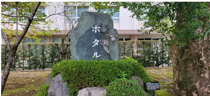
映画「ホタル」記念碑

知覧特攻平和記念会館入り口の写真です。会館の中の撮影が禁止されていたので撮れませんでした。特攻で亡くなった方々の写真や遺品、遺書が多く展示されていました。遺書はお母さんやお父さんに対してここまで育ててもらった感謝を綴るものがほとんどでした。中でもお母さんに感謝する遺書が一番多かったようです。特攻で亡くなった最年少は17歳だそうです。今の高校2年生にあたりますね。