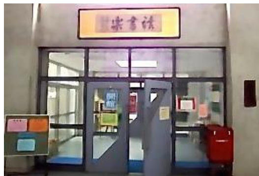
円覚別峰書の「読書楽」を掲げる