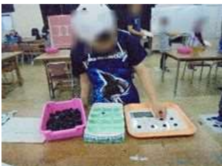
【ゴムパッキンの数え、箱入れ】