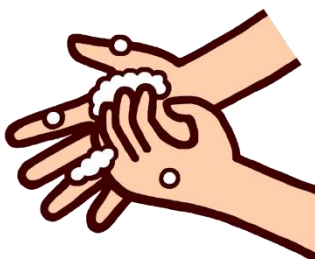
4.おおかみのポーズ