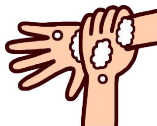
6.つかまえた！のポーズ