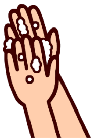
1.おねかしのポーズ