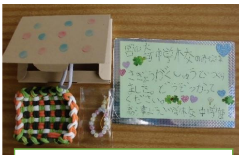
作業作品・メッセージカード

2月末に宮崎中学校支援級生徒から、一人一人に手作りのお礼カードをいただきました。皆さん大変喜んでくださったということでした。