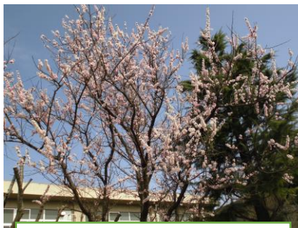
中庭の桜 (3月17日撮影)

最後になりましたが、1年間、PTAの保護者の皆様を始め、たくさんの学校応援団に支えられたことに感謝申し上げますとともに、引き続き、本校の取組にご理解とご協力をお願いいたします。