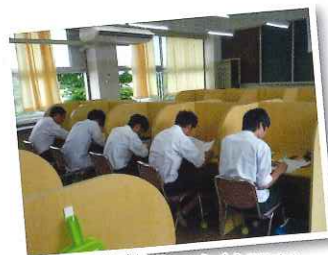
つるぞうルーム(自習室)

将来どんな人生を歩むか。 県鶴にはそのヒントがたくさんあるよ。 将来のビジョンを自分で「見出し」、 目指した目標を自分で「勝ち取る」力。 県鶴生は3年間でそれらを手にして、 社会に羽ばたいていくんです。