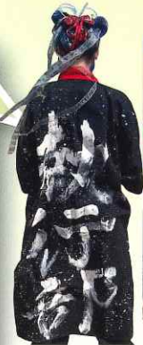
体育祭実行委員長

今年の体育祭は感染症対策も緩和され、生徒の笑顔や真剣な顔をたくさん見ることができ、最高の体育祭になりました。支えてくれた執行部や先生方、携わっていただいた皆さん全員にとっても感謝しています。次は皆さんの番です! R5年度の体育祭を更新できるかな?!