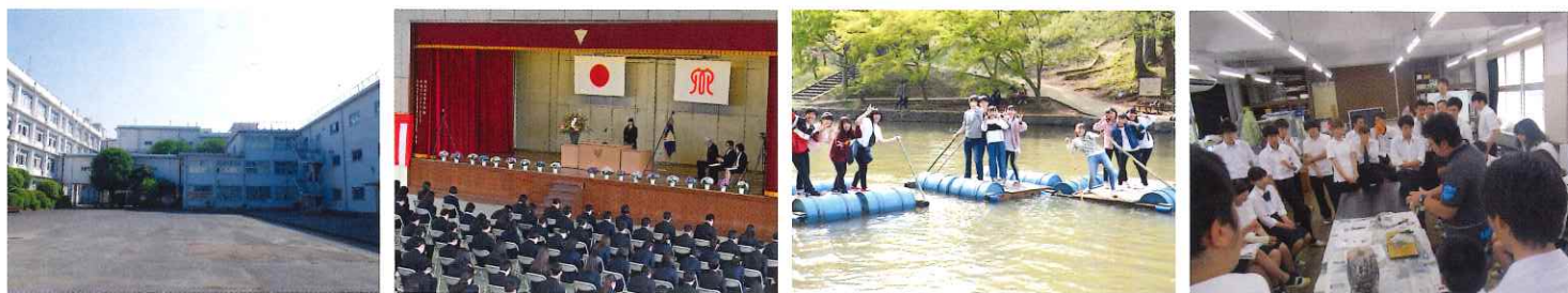
入学式 校外学習 OB・OG職業講演会

『?(なぜ)を!(できた)にかえて、未来をかえる』をモットーに、 県鶴生は1年間でいろんなことにチャレンジします!