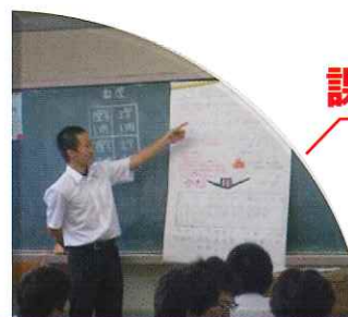
鶴見高校で育む4つの能力