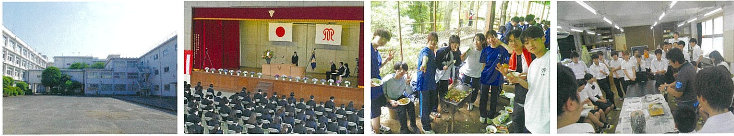
入学式 校外学習 OB・OG職業講演会

『Challenge and Change』をモットーに、 県鶴生は1年間でいろんなことにチャレンジします!