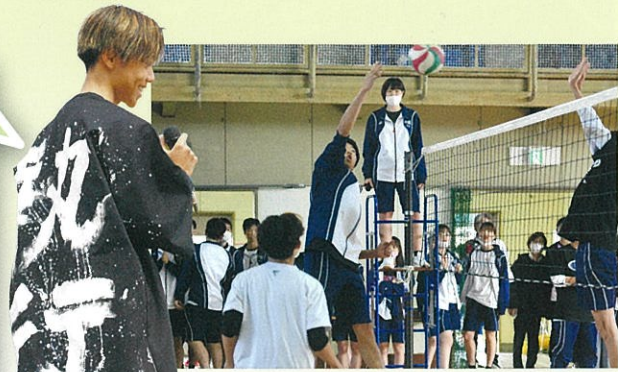
体育祭実行委員長 球技大会

県鶴の体育祭は、誕生月によって春団、夏団、秋団、冬団と4つの団に分かれています! 団の幹部や委員会のメンバーをはじめとして、生徒のみんなが作り上げる体育祭は激アツです! 実際、今年の体育祭でも、勝って嬉し泣き、負けて悔し泣きをたくさん見ました。それほど熱意のこもった体育祭です。生徒は自主自立の精神のもとそれぞれの個性を生かして参加するのが一番の特徴で、みなさんのイメージする「高校生」が楽しめると思います! 熱意と個性を生かした体育祭は他の高校に絶対負けない、そう言い切れると思います! 県鶴の体育祭で青春を楽しめー!!