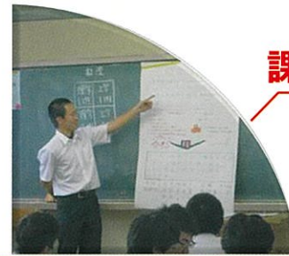
鶴見高校で育む4つの能力