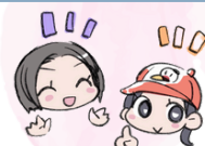
イラスト 書記さん作