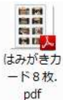
はみがきカード8枚.pdf