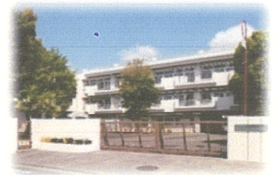
もともと小学校だった校舎を改装・リニューアルしました。給食もあります。

平成 25 年 4 月に横浜市瀬谷区に開校した、知的障害の生徒を対象とした高等部単独の県立特別支援学校です。生徒は主に瀬谷区、泉区の他戸塚区、大和市、藤沢市から通学しています。3 年生 42 名、2 年生 43 名、1 年生 42 名、計 127 名が在籍しています。『自己実現する人を学校・家庭・地域で支え、育む』ことが私達の基本理念です。「自己実現」は、子どもたちにとって少し難しい言葉ですが、「自分のやりたいことができるようになること」であり、そして「やったことの結果が自分だけでなく、他の人も幸せにすること」と説明しています。