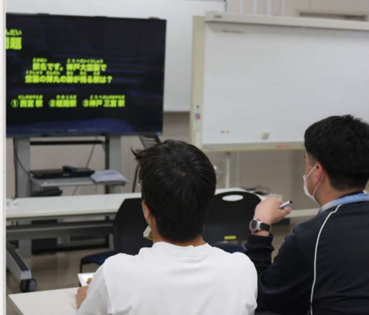
生徒の興味関心を活かしたイベント★