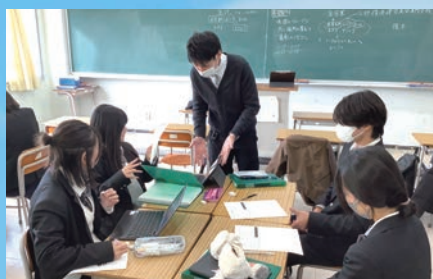
職業人インタビュー