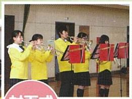
対面式 部活動紹介