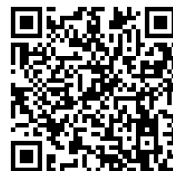
進路探究セミナー予定表

志望校が決まっている方、進学を考えているけど志望校が決まっていない方に向けて、「進路探究セミナー」も実施します。ぜひお気軽にご参加ください！（詳細は こちら !）