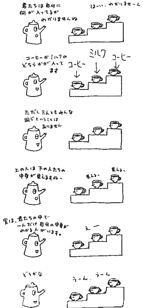
佐藤正彦『プチ哲学』より引用

さて、クイズの答えは分かりましたか。秋にはスクーリングが再開します。なりたい自分に向けて学習に取り組むみなさんを、引き続き応援します。