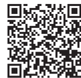
←進路説明会 申し込み