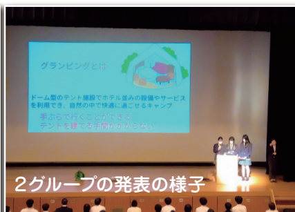
2グループの発表の様子