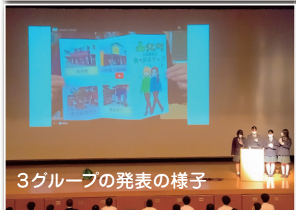
3グループの発表の様子