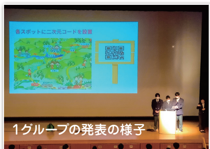
1グループの発表の様子