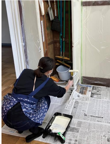
← ペンキ塗りの様子②