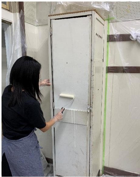
← ペンキ塗りの様子①