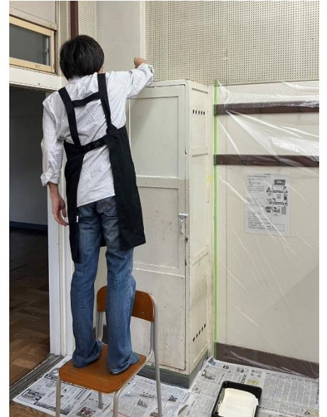
ペンキ塗りの様子③ ⇒