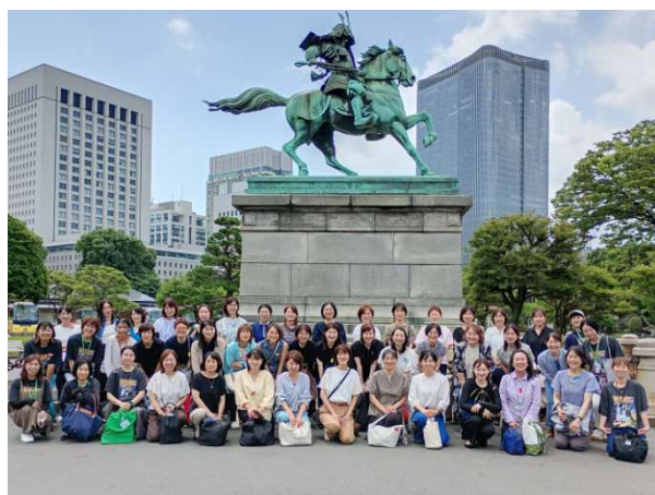
参加された皆さんと集合写真