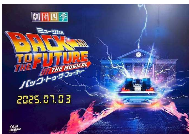
ミュージカルのポスター

切符を模した座席のチケットを受け取り、車内へ。ミュージカルのお題を思わせるような、電子時計のデコレーション。席にはセンスの良いお菓子の詰め合わせが置かれていました。自己紹介の後には席を超えて盛り上がり、あっという間に最初の目的地、皇居外苑到着