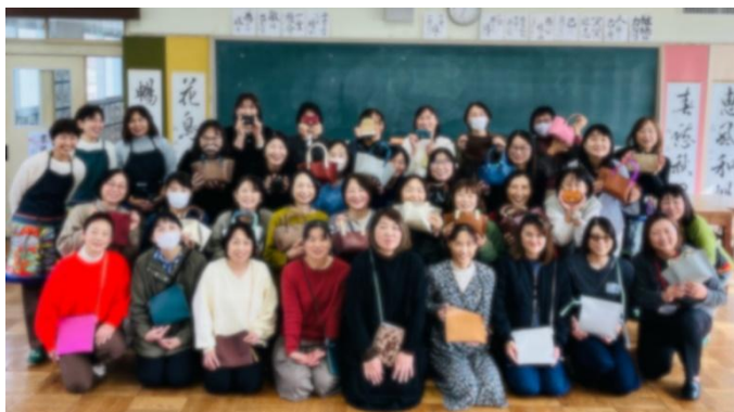
（午前の部にご参加の皆さま）

さぼてんのヒレかつサンドと 烏龍茶、TAKCAFEのパウンド ケーキでした。とても美味し かったです。