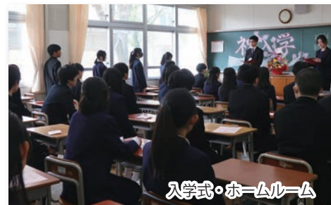
入学式・ホームルーム