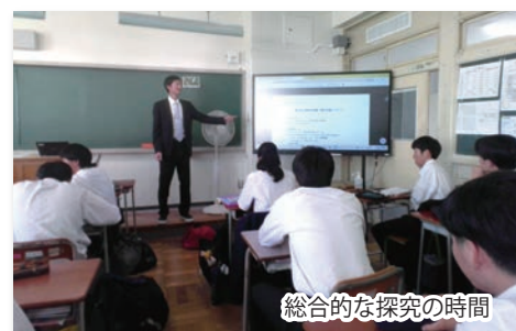
総合的な探究の時間