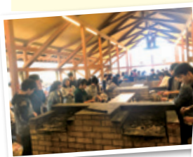
1年オリエンテーション

卒業式 学年末テスト 球技大会 フレデリックダグラス高校訪問 ニュージーランド交流校訪問