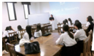
サマー・イングリッシュ・キャンプ

福島県のBritish Hillsを訪れ、日常の英語授業での学習事項を基礎に、更に高度な会話能力を身に付けられるよう、様々なアクティビティを通して英語を学習します。研修のみならず、生活全てに英語を必要とする同施設において、生きた英語の体得と国際感覚を身に付けることを目指します。