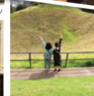
ニュージーランド