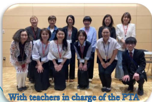
With teachers in charge of the PTA