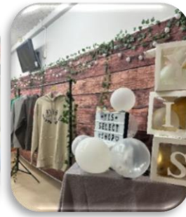
YIS SELECT SHOP