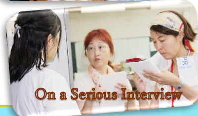
On a Serious Interview