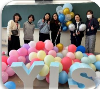
YIS SELECT SHOP