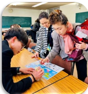
Teachers Reviewing the Draft