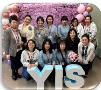
フォトブース製作