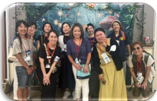
先生方も原稿をチェック