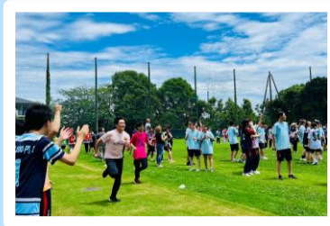
Relay of teachers' team participation