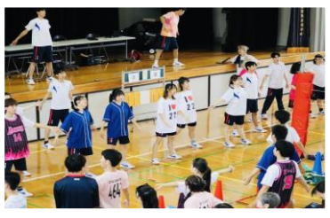
お疲れさまでした

「大会を開催するにあたり、私たち実行委員は運営について何ヶ月も前から話し合いを重ね準備をしてきました。その中でも当日の運営は特に大変でした。試合が終わった瞬間に対戦表と会場を調整して2ヶ所ある本部まで走って伝えに行ったり、各試合ごとに審判や補助も決めなくてはならないので、その場で考えて動くことが沢山ありました。しかし、前委員長がエキシビジョンマッチの運営を一緒に考えてくださったり、審判を率先して担当してくれる生徒がいて乗り越えることができました。大会が終わった後、たくさんの方が「楽しかった！」と話しているのを見て、皆で頑張ったよかったなと心から思いました。運営にご協力いただいた皆様、ありがとうございました！」