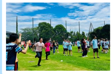
先生チーム参加のリレー