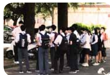
中学生対象学校見学会