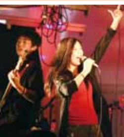
ポピュラーソング部