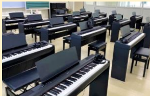
生活科学科総合実習室