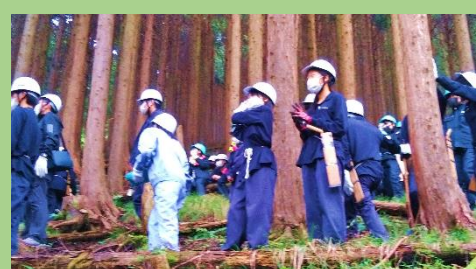
矢倉沢演習林 (南足柄市矢倉沢)