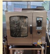
コッパ クリソオーブン