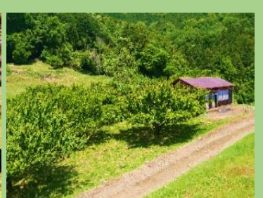
松田山果樹園（松田町松田惣領）