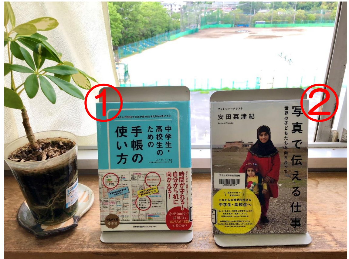
①日本能率協会マネジメントセンター『中学生・高校生のための手帳の使い方』(日本能率協会マネジメントセンター、2014年)

今やスケジュールはスマホで管理する時代。でも、あえて手帳を使ってみませんか？手帳初心者にもわかりやすい指南書。