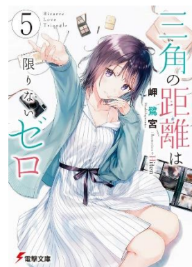
岬鷲宮『三角の距離は限りなくゼロ 5巻』(KADOKAWA、2020年)