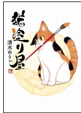
清水めりい『猫塗り屋』(KADOKAWA、2020年)

このコーナーでは、先月図書館に入ってきた資料の中から、図書委員や司書がおすすめの資料を選んで紹介します。