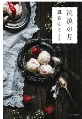
凧良ゆう『流浪の月』(東京創元社、2019年)

2020年本屋大賞を受賞した本作。「幼女誘拐事件」の「被害者」と「加害者」が、10年後偶然の再開をはたす。この二人の関係は何なのか。