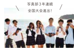
写真部3年連続 全国大会進出!