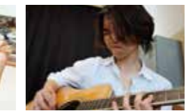
軽音楽部 全国大会入賞!