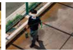
電子技術研究部 2年連続全国大会進出!