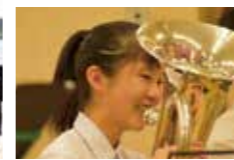
吹奏楽部 逗子葉山音楽祭出演!