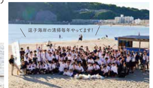
逗子海岸の清掃毎年やっています!